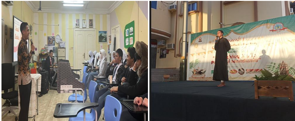
Gambar 2. Penyampaian materi sosialisasi kepada siswa SMA di SIJ