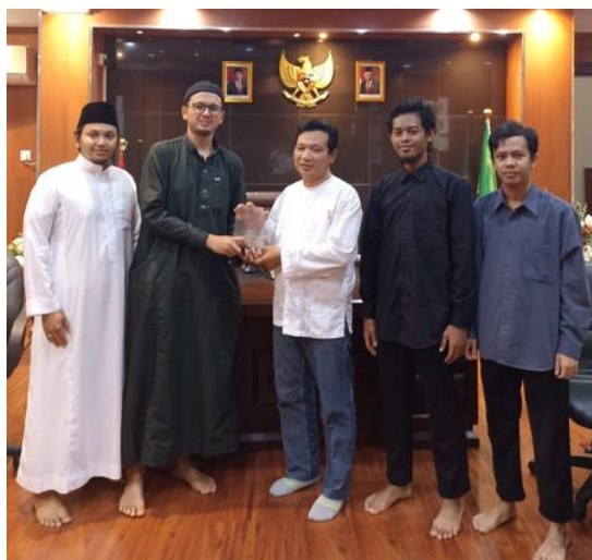
Gambar 4. Selesai acara sosialisasi dan pemberian cinderamata dari SIJ ke tim PKM PPMI Saudi Arabia

Kegiatan PKM ini telah selesai sesuai dengan jadwal. Pihak SIJ berharap kerjasama dan sosialisasi seperti ini rutin dilakukan. Hal tersebut akan lebih meningkatkan motivasi siswa SMA SIJ untuk terus mengejar pendidikan yang lebih tinggi. Tidak hanya siswa SMA, program seperti ini diharapkan dapat diberikan juga kepada jenjang SMP atau SD sehingga akan memberikan hasil yang lebih baik untuk jangka panjang.