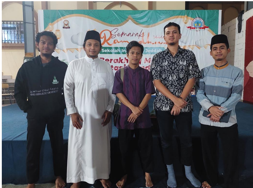
Gambar 1. Tim PKM PPMI Saudi Arabia berkunjung ke SIJ dan berdiskusi dengan perwakilan SIJ terkait sosialisasi yang akan disampaikan

disampaikan ke mereka. Persiapan dan pertemuan dengan pihak SIJ dapat dilihat pada Gambar 1.